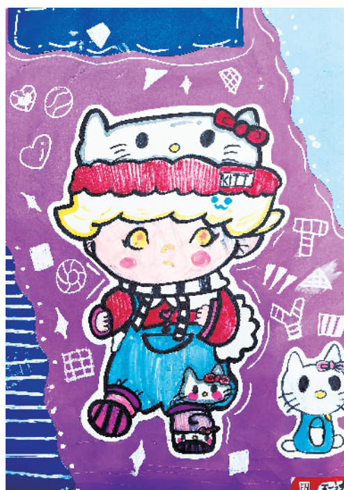
小记者:王一诺 一(5)班 辅导老师:郑慧敏