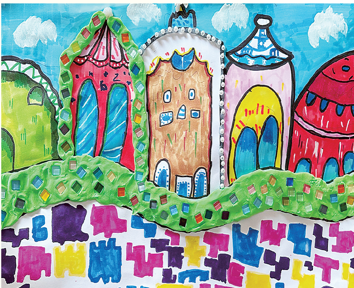
小记者:夏亦涵 三(1)班 辅导老师:刘锦

严,是我们的信念。 祖国母亲,你是我们的归宿。你的爱如海洋,深沉而广阔;你的恩赐如阳光,温暖而明亮;你的怀抱如港湾,安全而宁静。 祖国母亲,我们永远爱你。你的荣耀是我们的荣耀,你的梦想是我们的梦想,你的未来是我们的未来。